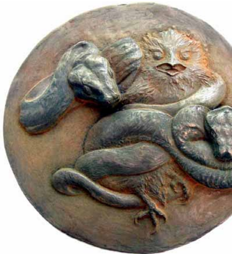
Imágenes del catálogo "Mitologías invisibles" UCM

Catálogo (en pdf): http://www.ucm.es/BUCM/foa/52803.php